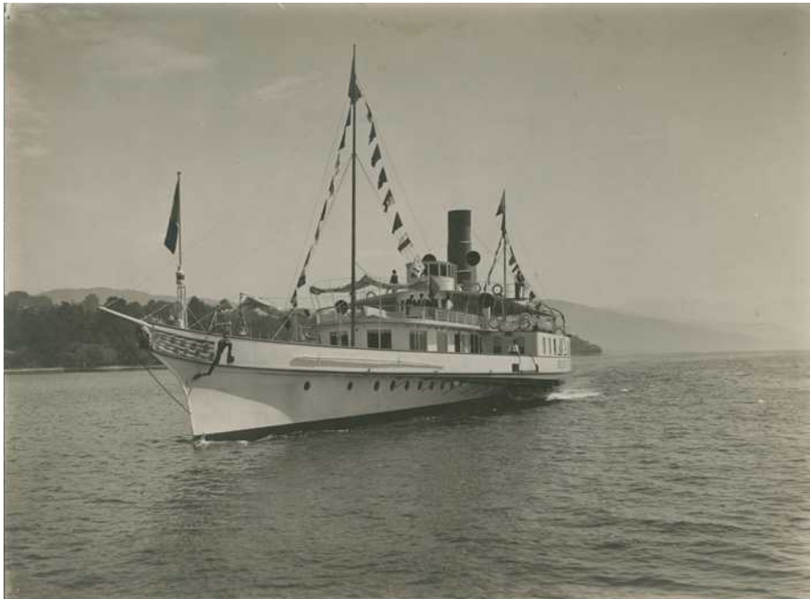
Ryffel, Inauguration du bateau HELVETIE II, 1926

Sans machine, HELVETIE II ne navigue plus depuis plus de 20 ans, bien qu'il soit classé monument historique d'importance nationale depuis 2011 (comme les autres bateaux à roues à aubes du Léman). Un projet de restauration est actuellement en cours d'élaboration. Si tout se déroule comme envisagé, la machine exposée au Musée du Léman pourra être remise à bord de son bateau d'origine.